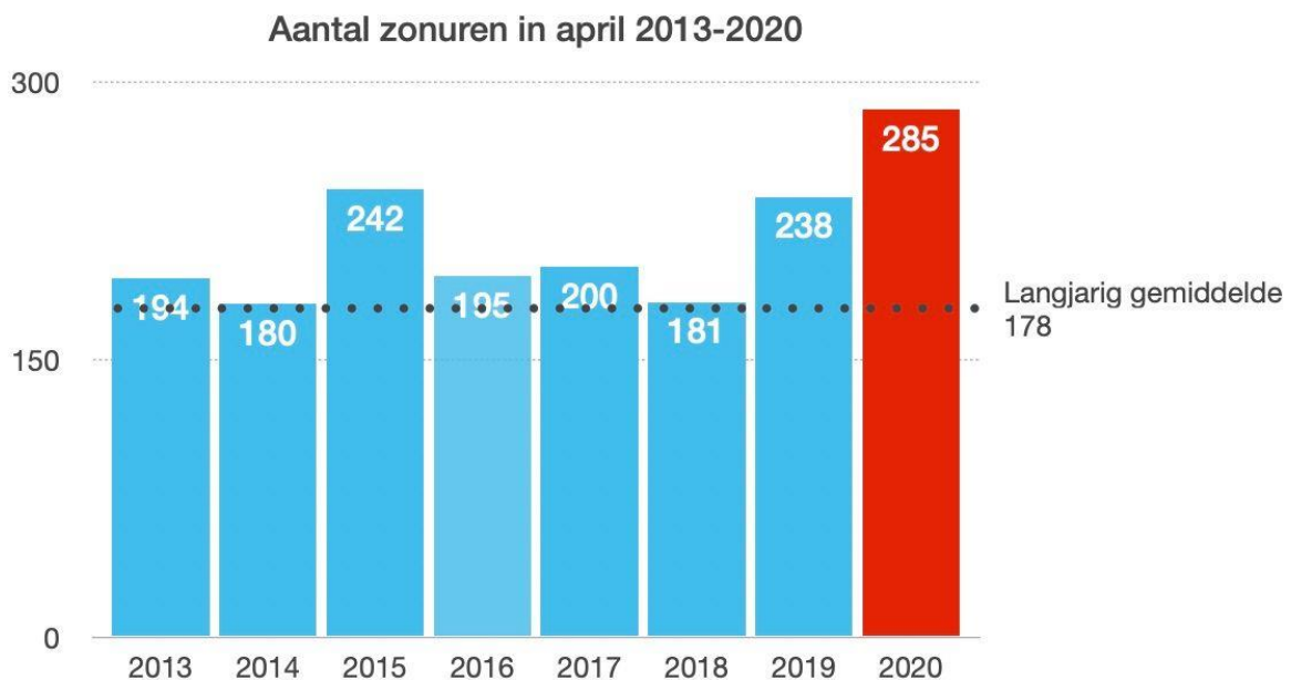
Afbeelding 1:

Onze zonnepanelen hebben een flitsende start gemaakt in dit fantastisch zonnige voorjaar! De maand april 2020 telde 285 zonuren, terwijl april gemiddeld 178 zonuren heeft. Een absoluut record!